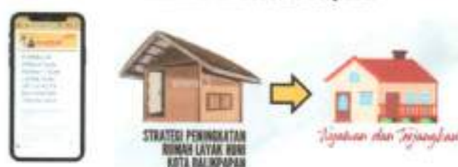
Gambar 2. Inovasi Griyaku